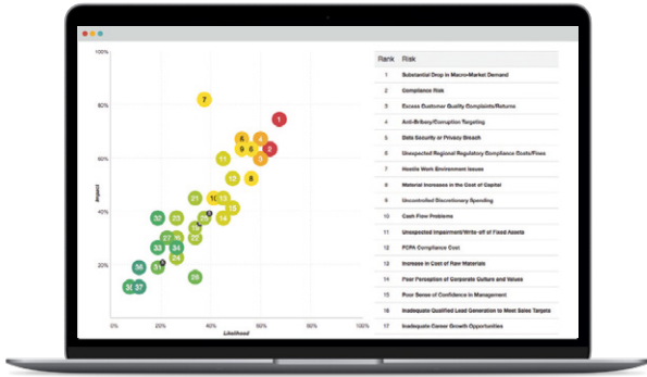
Figura 2: Los mapas de riesgo mejoran las decisiones estratégicas